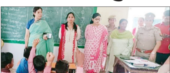
सदस्या, उत्तर प्रदेश राज्य बाल अधिकार संरक्षण आयोग द्वारा अधिकारियों के साथ की गई समीक्षा बैठक