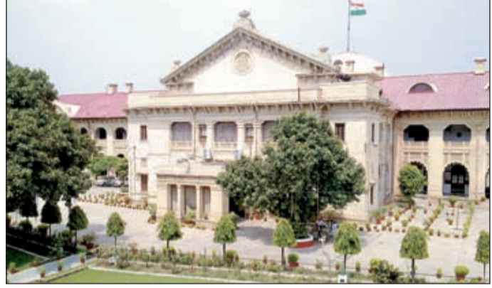
“मस्जिद में लाउडस्पीकर से अज्ञान देना संविधान में प्रदत्त मौलिक अधिकार की श्रेणी में नहीं आता है। अज्ञान, इस्लाम का अभिन्न अंग तो है, लेकिन लाउडस्पीकर से अज्ञान देना इस्लाम का हिस्सा नहीं है।” -इलाहाबाद हाईकोर्ट