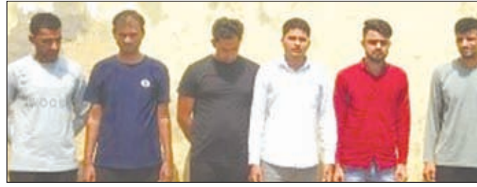
कैनविज टाइम्स संवाददाता

लखनऊ। यूपी पुलिस भर्ती एवं प्रोन्नति बोर्ड की ओर से कराई गई दरोगा की सीधी भर्ती ऑनलाइन परीक्षा में अपनी जगह दूसरे साल्वर को बैठाकर उत्तीर्ण होने वाले छह अभ्यर्थियों को शनिवार को गिरफ्तार कर लिया गया। महानगर में रिजर्व पुलिस लाइन में शैक्षिक दस्तावेज और शारीरिक मापदंड परीक्षण के दौरान अभ्यर्थियों की करतूत का पता चला। आरोपी अभ्यर्थियों ने सात-सात लाख रुपये देकर अपनी जगह दूसरे व्यक्ति को बैठाकर परीक्षा पास की थी।