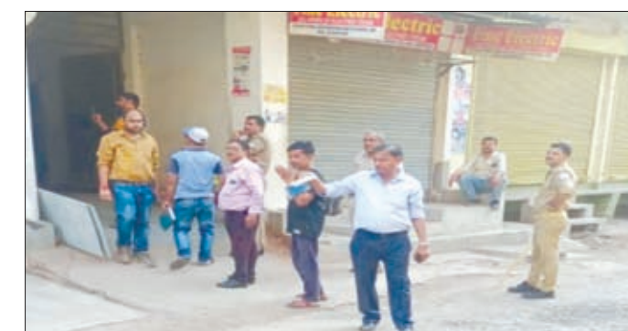
कैनविज टाइम्स संवाददाता

लखनऊ। बिजली चोरों के खिलाफ बिजली विभाग की लगातार छापेमारी की कार्रवाई जारी है। शनिवार को तड़के सुबह चौक डिवीजन के नादान महल उपखंड के बिजली कर्मियों व विजिलेंस की टीम ने संयुक्त रूप से बिजली चोरों के खिलाफ छापेमारी की यह छापेमारी तक्रिया जंगली शाह, विक्टोरिया स्ट्रीट, गढ़ैया, बिल्लीच पुरा, तक्रिया जहांगीर हाता आदि इलाकों में