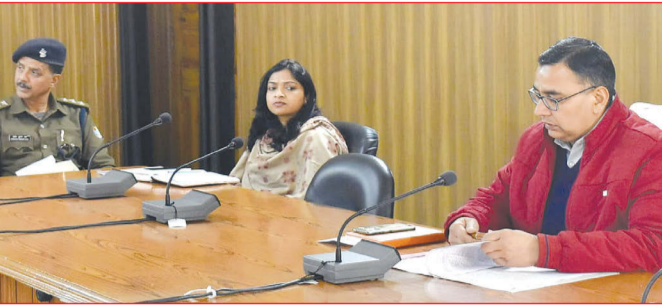
कैनविज टाइम्स संवाददाता

जा रहा है। 44वें दिनों में अबतक 1,40,852 से अधिक रोगियों ने पीएमटीबीएमए के तहत अपनी सहमति दी और 50,799 से अधिक नए निश्चय मित्र पंजीकृत किए गए। अब तक, 8,51,194 से अधिक लोगों की जांच की गई, जिनमें से 27,630 लोग सकारात्मक पाए गए हैं।