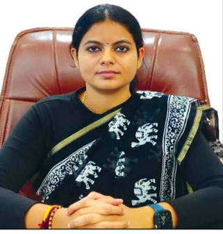
अधिकारी बन्धु, ज्वाइंट मजिस्ट्रेट मेरठ तथा असिस्टेंट कलेक्टर रायबरेली के पद