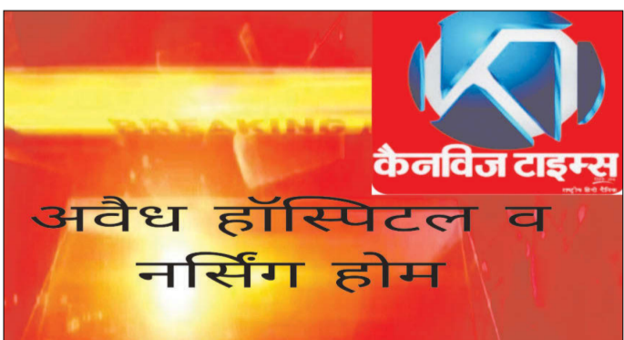
केनविज टाइम्स संवाददाता

गोंडा :जिले के तहसील करनैलगंज क्षेत्र में संचालित अवैध अस्पतालों में प्रशिक्षित स्टाफ नर्स नहीं होती हैं और न ही ट्रेड टेक्नीशियन रखे जाते हैं इस तरह के अस्पतालों में लापरवाही की हद तो यह है कि कई अस्पतालों में आयुर्वेदिक स्नातक की डिग्री पर चिकित्सक गंधीर अवस्था के मरीजों का सीजर ऑपरेशन करते हैं। वही परसपुर और करनैलगंज में दर्जनों से अधिक सैकड़ों अवैध हॉस्पिटल और ट्रीटमेंट सेंटर चल रहे हैं। कोई अस्पताल दो कमरे में चल रहा है तो कोई किराए के मकान में इनमें