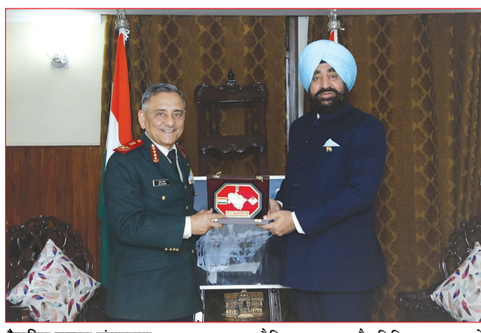
कैनविज टाइम्स संवाददाता

और पूर्व मंत्री पवन बंसल को भी निगम में घुसने नहीं दिया गया। दोनों नेताओं ने कहा कि इसको लेकर वह हाई कोर्ट जाएंगे। भाजपा पार्षदों ने कहा कि चुनाव अधिकारी पंजाब सरकार के अफसर हैं, हमें शक है कि पंजाब सरकार के इशारे पर चुनाव टाले गए हैं। चुनाव रद्द होने के बाद आप के राज्यसभा सांसद राघव चड्ढा ने कहा कि भाजपा यह चुनाव रद्द करना चाहती है, क्योंकि भाजपा के पास बहुमत नहीं है। इस बार आईएनडीआई गठबंधन का यह पहला चुनाव था। गठबंधन इस चुनाव को जीतने जा रहा था, लेकिन भाजपा गैर कानूनी हथकंडे अपना कर चुनाव को रद्द करवाना चाहती है। इन्होंने चुनाव अधिकारी को भीमर घोषित कर दिया है। राघव चड्ढा ने बताया कि अब हम पंजाब एवं हरियाणा हाईकोर्ट जाएंगे और कोर्ट से मेयर का चुनाव कराने की गुहार लगाएंगे।