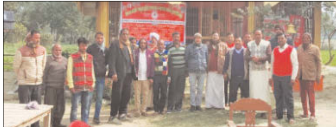
केनविज टाइम्स संवाददाता