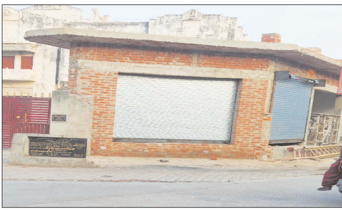
केनविज टाइम्स संवाददाता गोंडा। शहर के मालवीय नगर पुरानी