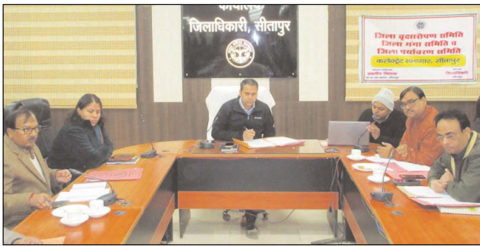
केनविज टाइम्स संवाददाता