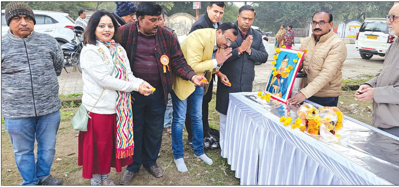
कैनविज टाइम्स संवाददाता लखनऊ। सुभाष चंद्र बोस पार्क, नेहरू एनक्लेव, गोमती नगर, में सुभाष चंद्र बोस की जयंती पर एक कार्यक्रम

आयोजित किया गया जिसमें सुभाष चंद्र बोस की प्रतिमा पर माल्यार्पण कर सभी नेहरू इन्क्लेव के निवासियों ने उनके आजादी में योगदान को याद किया गया तथा उनके नाम पर इस पार्क