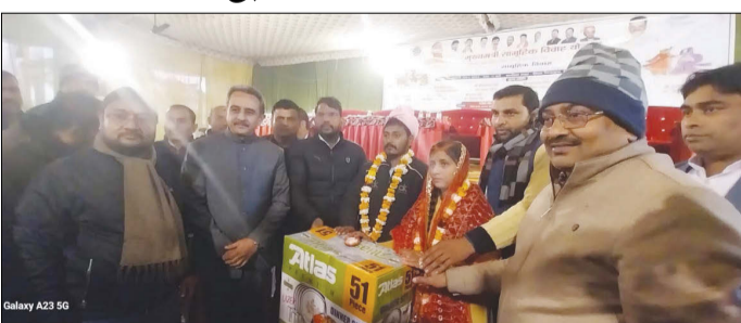
केनविज टाइम्स संवाददाता

गोण्डा। जिले में बुधवार को मुख्यमंत्री सामूहिक विवाह योजना के लिए पांडाल सजाया गया। यहां 618 बेटियों का विवाह धूमधाम से कराया गया। इनमें से 39 बेटियों का निकाह भी हुआ। बीजेपी सांसद कीर्तिवर्धन सिंह उर्फ राजा भैया मेहनौन विधायक विनय कुमार द्विवेदी संग कई जनप्रतिनिधियों और अफसरों ने जोड़ों को आशीर्वाद दिया। बेटियों को उपयोगी सामग्री देकर विदा किया गया।