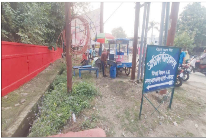
केनविज टाइम्स संवाददाता

गोण्डा। जिले में अब दिल्ली, लखनऊ, इंदौर की तरह स्ट्रीट फूड का मजा ले सकेंगे। लखनऊ की चटोरी गली, इंदौर की