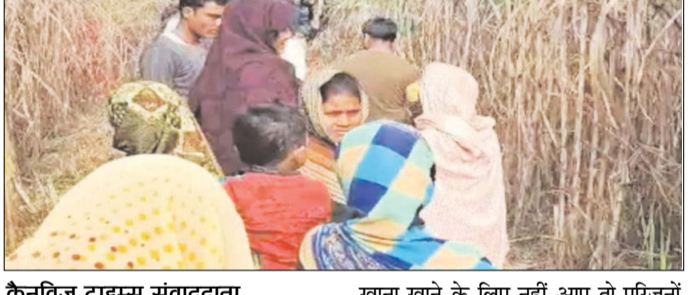
केनविज टाइम्स संवाददाता