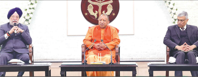
कैनविज टाइम्स ब्यूरो

लखनऊ। केंद्रीय पेट्रोलियम एवं प्राकृतिक गैस मंत्री हरदीप सिंह पुरी ने घोषणा की है कि उत्तर प्रदेश में जल्द ही 100 नए बायोगैस प्लांट स्थापित होंगे। उन्होंने कहा है आज जनपद बदायूं में कम्प्रेस्ड बायो गैस के नए प्लांट का उद्घाटन होने जा रहा है और राज्य के 8 अन्य जनपदों जौनपुर, अमेठी, सीतापुर, फतेहपुर, बहराइच, बरेली, कन्नौज और बदायूं में कम्प्रेस्ड बायो गैस के नए संयंत्र का शिलान्यास भी किया जाएगा। अब तक