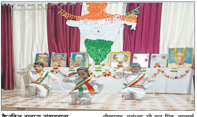
केनविज टाइम्स संवाददाता