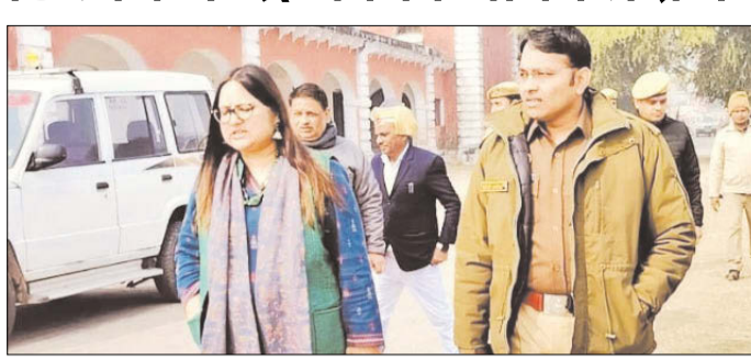
केनविज टाइम्स संवाददाता

गोंडा। जिलाधिकारी व पुलिस अधीक्षक कोतवाली क्षेत्र के स्ट्रांग रूम का निरीक्षण करते हुए निदेशित किया कि बिना अनुमति स्ट्रांग रूम में कोई भी प्रवेश नहीं करेगा। ईवीएम और वीवीपैट मशीनों से छेड़खानी न हो इसका विशेष ध्यान रखा जाए।