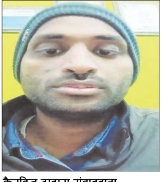
केनविज टाइम्स संवाददाता

आखिरी मैसेज में लिखा- मौत का कारण मेरी पत्नी