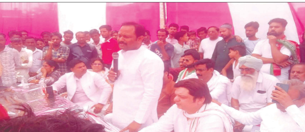
केनविज टाइम्स संवाददाता