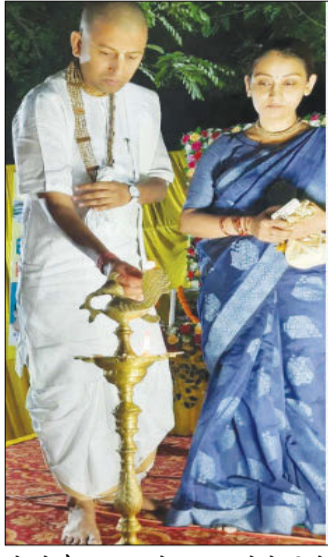
बोलते हैं। आनंद को प्राप्त करने के लिये

हम जीवात्मा हैं और हम जितना सुख लेना चाह रहे हैं, वह शरीर के स्तर पर पा लेना चाह रहे हैं। उन्होने कहा कि शरीर से मिलने वाला सुख क्षणिक है स्थाई सुख नहीं है। स्थायी सुख ऐसा सुख है, जो निरन्तर बढ़ता जाए उसे आनंद